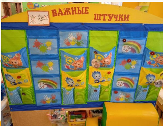
Панно «Важные штучки» (кармашки для хранения детских ценностей)