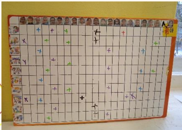
Экран выбора деятельности в подготовительной группе