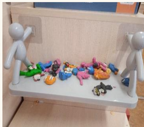
Полочки для хранения детских работ в игровом пространстве группы