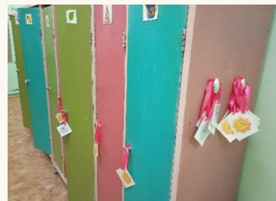
Игровые маркеры «Солнышки и точки»