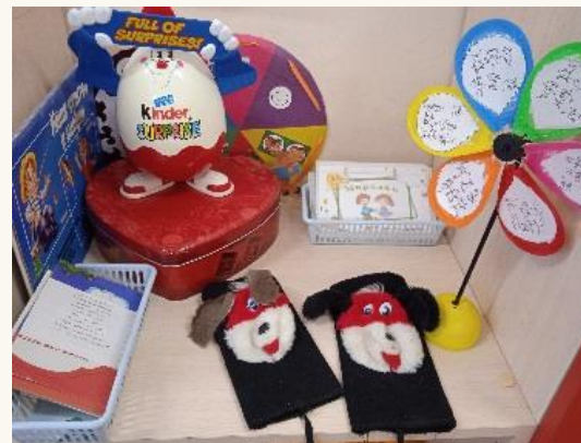
Мирилки и дружилки