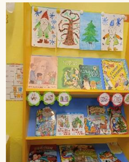
Украшение группы детскими работами